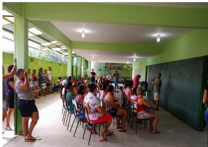
Palestra Sensibilização para Pais E.M. Henrique Tavares – Barra do Sahy