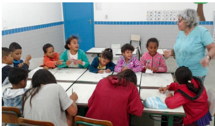
Projeto EDUCAE – Amor-Exigentino – E.M.E.I, Peixinho Dourado– Maresias