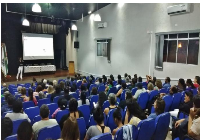
Palestra Dia Internacional Contra as Drogas Sindicato dos Petroleiros