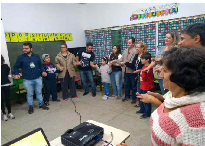
Projeto EDUCAE – Escola Maria Francisca Tavoraro – Pontal da Cruz