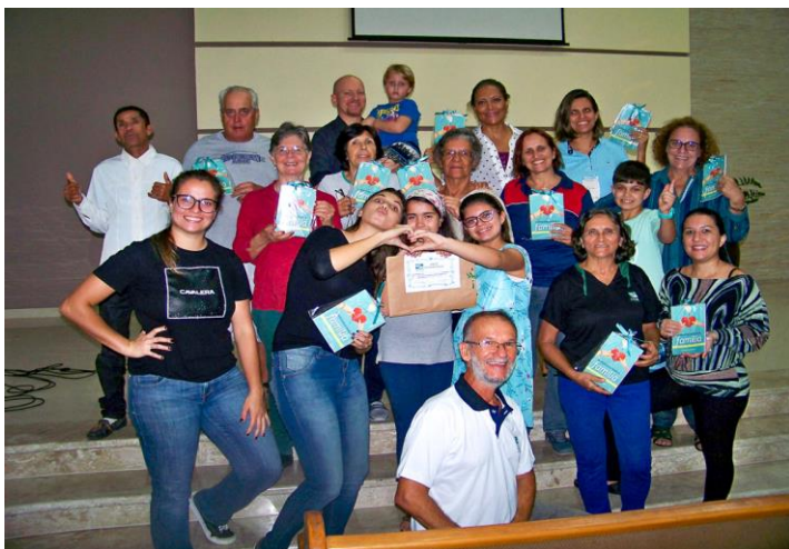
Projeto EDUCAE – Igreja Adventista – Vila Amélia