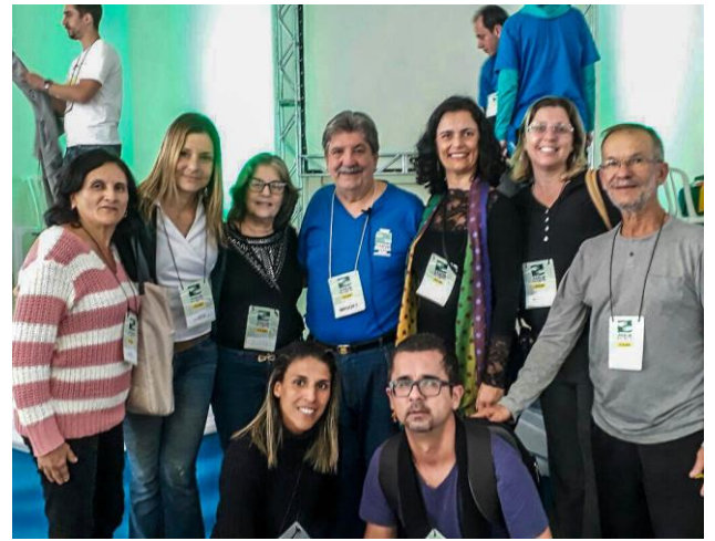
Projeto PQVAE – Famílias na Sobriedade – Grupo Centro