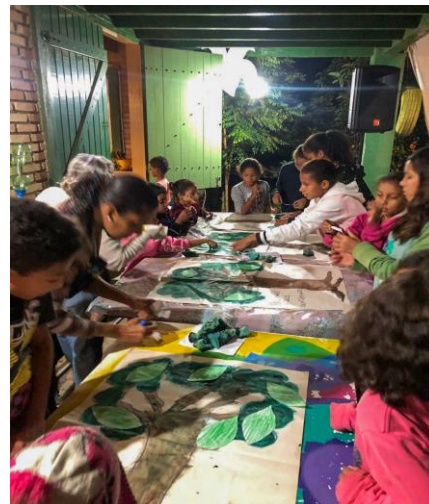
Projeto EDUCAE – Amor-Exigentino – E.M.E.I, Peixinho Dourado– Maresias